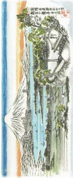
当山蔵 富士三保の松原の浮世絵