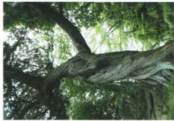
7 大樹 榎柏