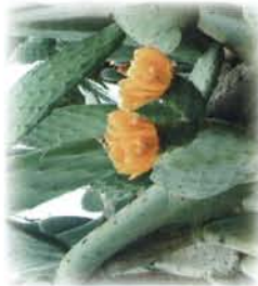
●サボテンの花 7月頃

境内の須弥山式の観富園庭園は東海の名園として知られています。四季折々色々な花が咲きます。